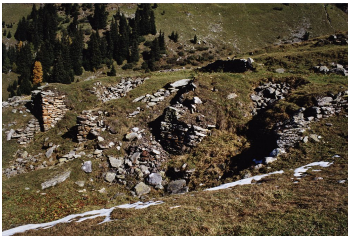
Titel: Röstofen auf der Alp Sut Fuina (Nr. 1 auf der Übersicht)