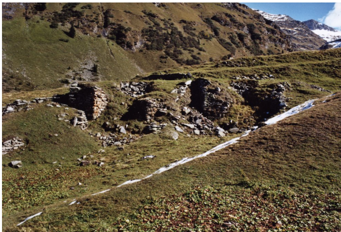
Titel: Die beiden Röstöfen auf der Alp Sut Fuina (Nr. 1 auf der Übersicht)